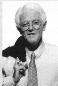
Peter Lynch: Mit seinem Fonds Fidelity Magellan lieferte er von Mai 1977 bis Mai 1990 die weltweit beste Rendite.